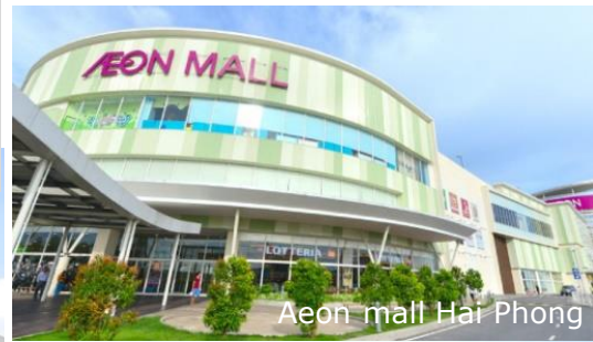
Aeon mall Hai Phong