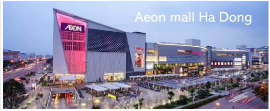
Aeon mall Ha Dong