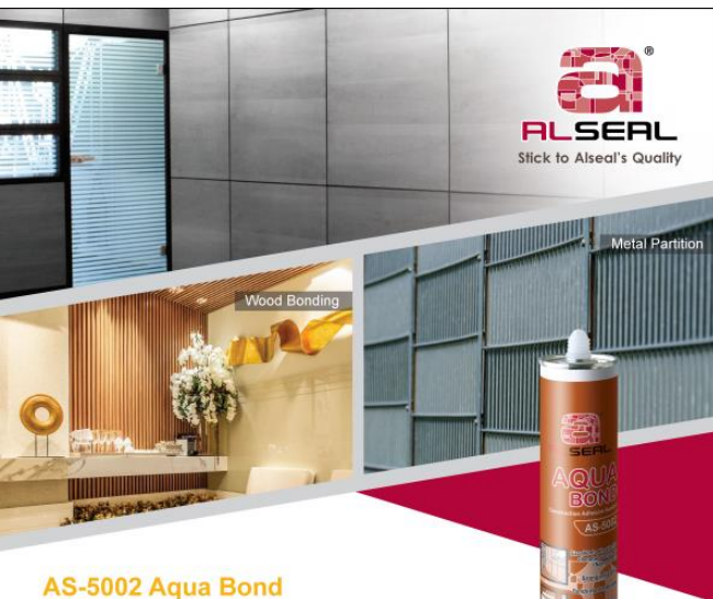
AS-5002 Aqua Bond