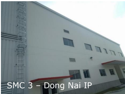
SMC 3 - Dong Nai IP